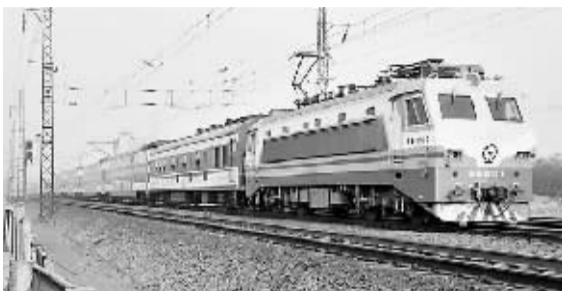
12月20日,在京广铁路线上,一列客运列车即将驶入河北邯郸站。

路,在列车开行、客运产品、货运产品、列车编组、车流径路、机车运用等多方面都发生了较大变化。 客运方面,根据新图方案,铁路部门将增开直通旅客列车53对,其中动车组43对、特快列车1对、快速列车5对、普通快车4对。变更运行区段10对、改变运行径路38.5对、变更列车等级24对。 根据客流预测和车底到位情况,新图合理安排了新线动车组列车开行方案:长吉线安排动车组列车20对,取消既有管内列车9对,其中经