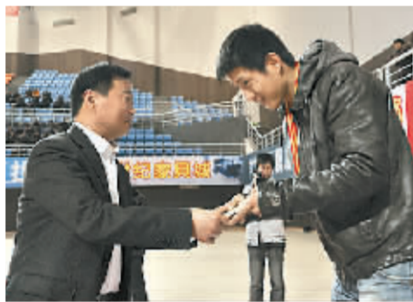
副市长李军为运动员颁发获奖证书。