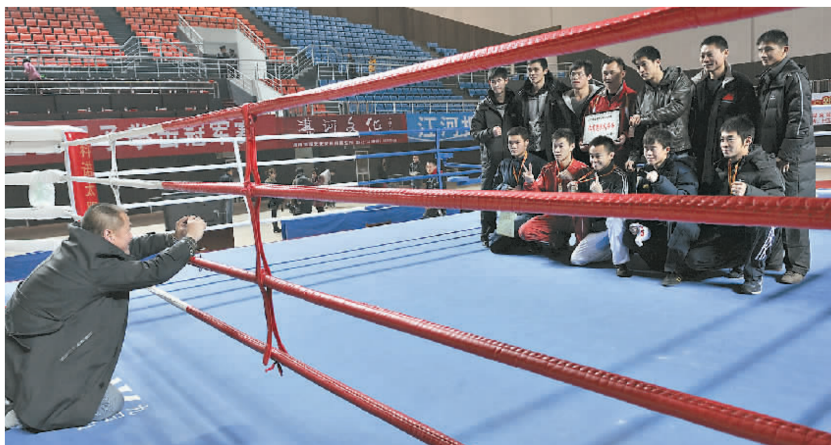
颁奖仪式结束后,运动员们在拳击台上合影留念。

河南重竞技中心从2001年成立至今,共经历了两届奥运会、两届亚运会和两届全运会,并取得了较好成绩,其中金牌分布是:2004年雅典奥运会,我省运