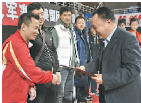
市政协主席张俊成为优秀运动员教练颁发荣誉证书。