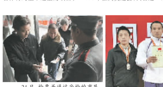
24日,检票并通过安检的市民。

据李岩介绍,重竞技体育包括五大项:拳击、跆拳道、摔跤、柔道和举重,属于省体育局重中之重的项目;省重竞技中心共有该五大项的11支运动队:男女自由式摔跤、古典式摔跤和男女举重、男女柔道。