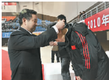
市人大常委会副主任郭文涛为运动员颁发奖牌。