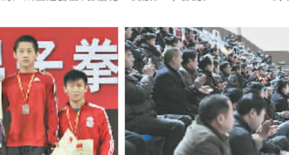
▲24日,看到精彩处鼓掌的观众。

动员陈中夺得跆拳道67公斤以上级金牌;2008年北京奥运会,我省运动员张志磊夺得拳击91公斤以上级银牌,“张志磊历史性地为中国拳击夺得了一枚宝贵的重量级银牌,使中国队首次在奥运会拳击奖牌榜上傲视群雄名列榜首,创造了历史,让世界惊讶!”在刚刚结束的广州亚运会上,省重