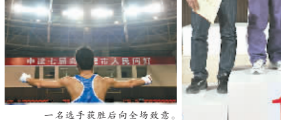
一名选手获胜后向全场致意。

动员陈中夺得跆拳道67公斤以上级金牌;2008年北京奥运会,我省运动员张志磊夺得拳击91公斤以上级银牌,“张志磊历史性地为中国拳击夺得了一枚宝贵的重量级银牌,使中国队首次在奥运会拳击奖牌榜上傲视群雄名列榜首,创造了历史,让世界惊讶!”在刚刚结束的广州亚运会上,省重