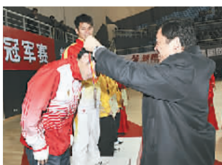
国家体育总局拳击跆拳道运动管理中心主任常建平为亚军颁发奖牌。