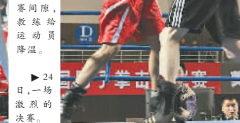
▶24日,一场激烈的决赛。