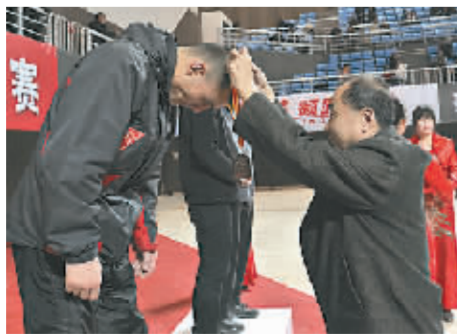
市体育局局长路照峰为获奖运动员颁发奖牌。