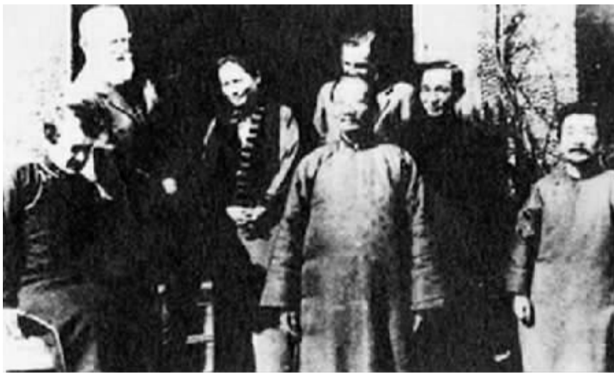
1933年2月17日,鲁迅与宋庆龄、萧伯纳等摄于上海宋宅的合影。

然后,众人在园中一起合影,留下3张珍贵的照片。那张7人合影的照片后来广为流传。上世纪60年代时,由于林语堂是资产阶级学者,伊罗生被认为是“托派”,他们的形象不翼而飞,照片上剩余的5个人也被移了位。“文革”结束后,他们又被挪了回来,这张珍贵的照片也恢复了它的真貌,它见证了中西方文化交流史上的一段佳话。