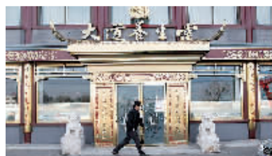
大道堂已关门停业。