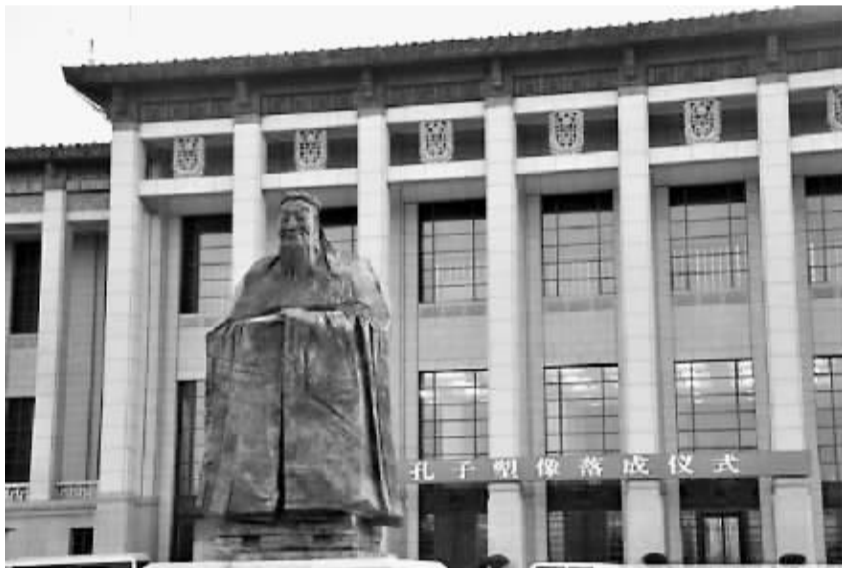
一座总高为9.5米的孔子青铜雕像在国家博物馆北广场落成。

据京华时报消息 11日,为弘扬和体现中华优秀传统文化,一座总高为9.5米的孔子青铜雕像在国家博物馆北广场落成,天安门地区又添文化新地标。