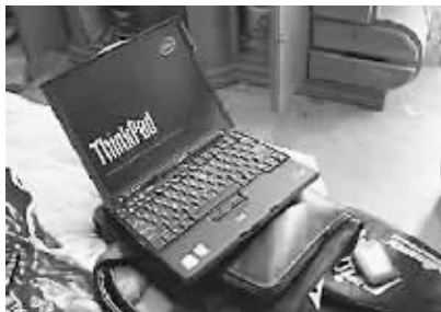
警方在嫌疑人家中查获的赃物。