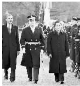
胡锦涛主席在奥巴马总统陪同下检阅仪仗队。

奥巴马重申,美国坚持一个中国政策,遵守美中三个联合公报。美方乐见两岸关系不断改善并为此深受鼓舞,希望两岸关系继续取得进展。