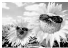
网友制作的“向日葵族”头像

“兔年里,我要做一朵积极的向日葵,给点阳光就能灿烂。”春节期间,不少网友将这样的新年愿望作为自己的MSN签名,“向日葵族”也因此成了网络热门词汇。相比“穷忙族”“草莓族”的消极心态,“向日葵族”以健康的形象赢得青睐,网友们纷纷将此作为新年目标。