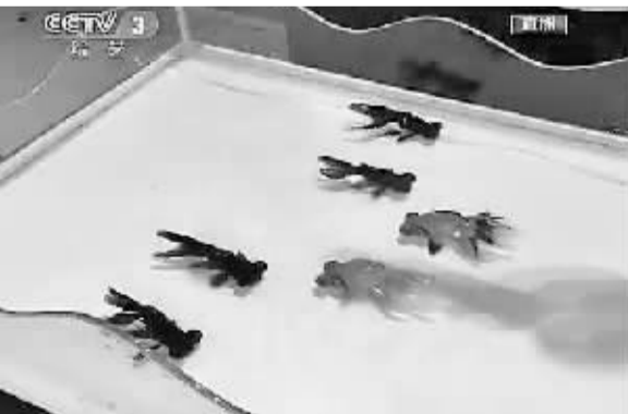
魔术《年年有鱼》掀起春晚的一个高潮

金鱼作道具让整个魔术变得更加生动,也更具观赏性。难怪观众惊呼:“不可思议!神奇莫测!”