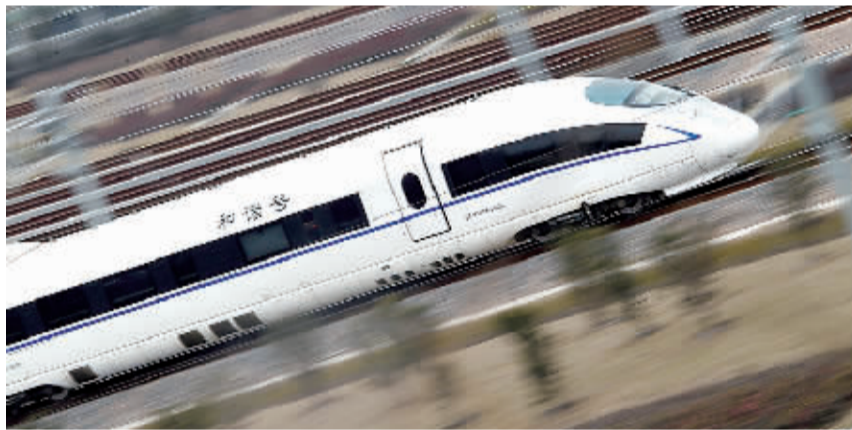
2月20日,一列高速动车组正快速驶离铁路上海虹桥站。

据新华社上海2月20日电(记者 贾远琨 齐中熙)20日起,从枣庄西至上海虹桥的645公里京沪高铁上海段开始进行联调联试,调试项目将包括新一代高速动车组试验和时速400公里高速综合检测列车检测系统试验等。该联调联试工作将于5月份完成,确保6月份具备试运行条件。