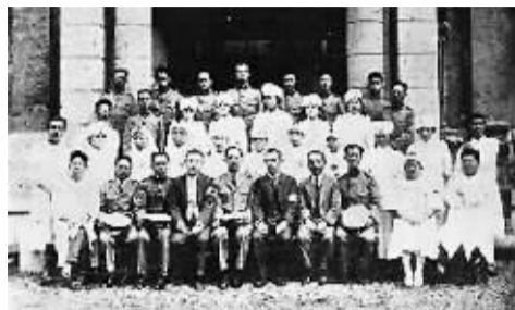
1923年,中国红十字会赴日救援队出发前合影。

1923年日本关东地震消息传来,北洋政府一面号召国民捐款援助,一面派军舰运送物资前往日本赈济灾民。