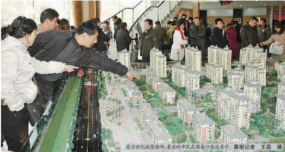
东方世纪售楼部,看房的市民在围着沙盘选房子。