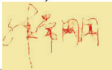
蜘蛛体的“非常网闻”。