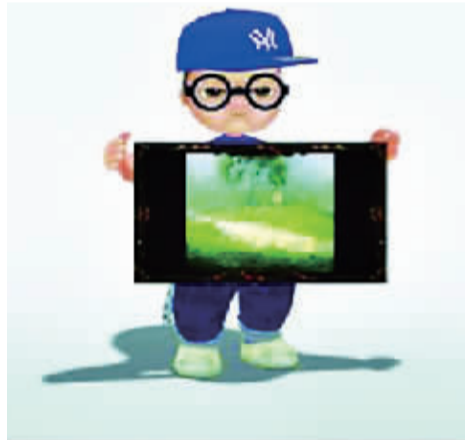
彭帅在视频中化身这个形象推荐自己。

在无数的毕业生疯狂“赶场”各大招聘会的时候，一则名为《2011 最给力的求职简历，求职必看，不看抱憾终身！》的帖子引发了无数学生的围观。毕业生们惊呼：“原来简历还可以这么做！”