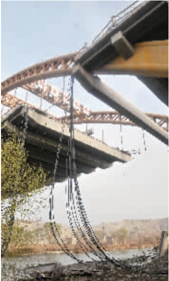
新疆库尔勒孔雀河大桥部分垮塌无人伤亡

多个小时，如果含量高几个小时就能检测出来。苏旭说，环保部公布的数据，空气当中有微量的放射性物质碘-131 存在，由于空气当中的放射性物质沉降到地面，会污染地面上露天生长的蔬菜。雨雪天气会加速沉降，相当于把空气中的放射性物质“洗”下来了。因此，在我国部分省区市一些地区菠菜、莴苣叶等一些蔬菜在检测当中有微量的放射性碘-131。苏旭指出，由于空气当中的放射性物质是极其微量的，因此自然沉降，或是雨雪加速沉降下来的也是极微量的。现在检测到蔬菜表面沾染的放射性物质是非常微弱的。每天食用一公斤这样的蔬菜，产生的辐射剂量负担相当于天然辐射本底一天量的千分之一到千分之三左右。苏旭还告诉记者，我国已经禁止从日本的 12 个县进口食品、食用农产品及饲料，日本受污染的食品很难进入国内。另外，苏旭在回答记者提问时还指出，据专家分析，目前日本福岛核电站附近海洋受核放射物污染比较严重，但到目前为止对我国近海没有影响。海洋里的放射性物质扩散比较缓慢，而且海洋的海水量很大，扩散过程中随海水上下涌动，也会不断沉降。