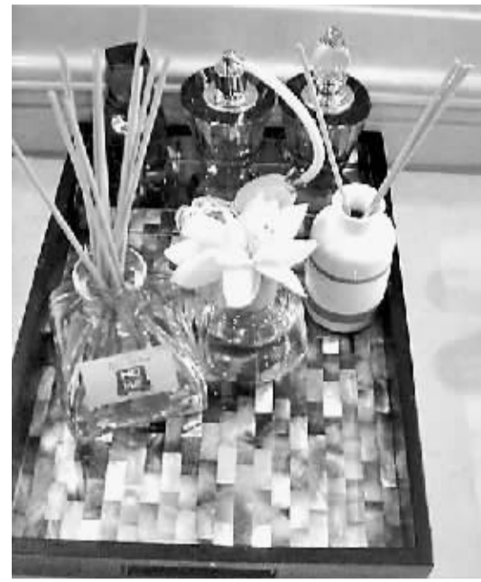
新款的特色香薰瓶,有绿茶、玫瑰、黄瓜等多种味道可以选择,整个家里都可以充满其散发的味道,要多温情有多温情。