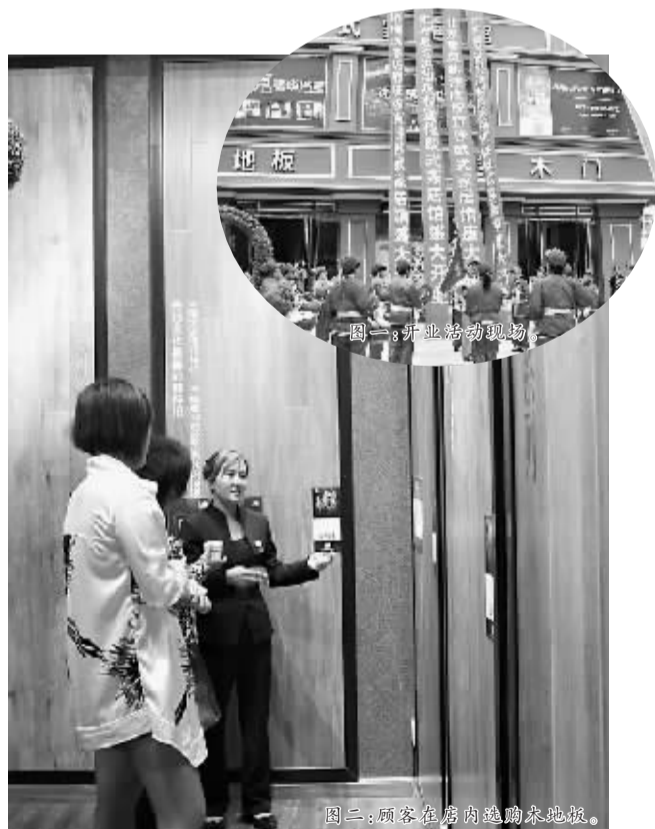
图一:开业活动现场。