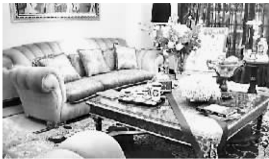
欧式的氛围里面,饰品是永远不嫌多的。看看托盘上的宫廷组合茶具,优雅又有品,还有清新绿意的花器,很适合放在此刻这个初夏的家里。

欧式的浪漫元素,很适合女人,尤其是我们的妈妈。它强调以华丽的装饰、浓烈的色彩、精美的造型达到雍容华贵的装饰效果。工艺上处理都很精细,主要是用料和家具来体现气派。客厅顶部常用大型吊灯,并用华丽的枝形吊灯营造气氛。门窗上半部多做成圆弧形,并用带有花纹的石膏线勾边。罗马柱是典型欧式元素,一般都会出现在门厅或者分隔区域的地方,再配以壁炉的装饰足以烘托出空间的豪华。除了硬装外,主要是采用家具和软装饰来营造整体效果。当然少不了搭配浪漫的罗马帘,精美的油画,制作精良的雕塑工艺品,这些都是浪漫感觉不可缺少的元素。