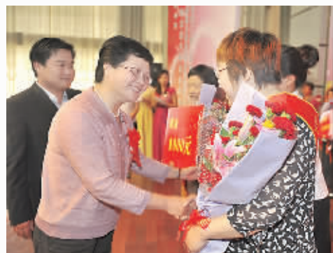
副市长高雅玲为“十佳母亲”颁奖。