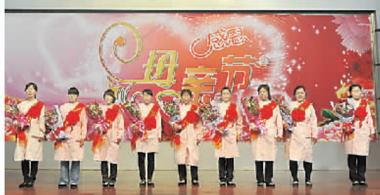
市社会福利院保育员群体获得“十佳母亲”特别奖。