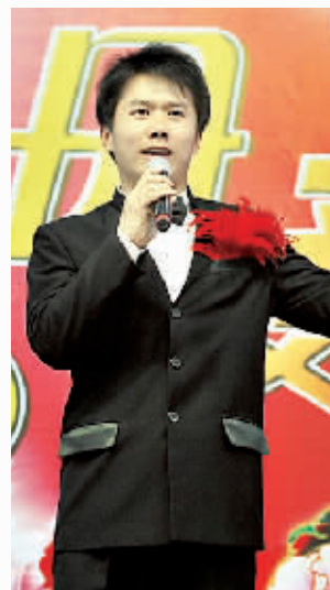
曹旺男声独唱《母亲》。