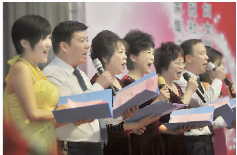
诗朗诵《母亲的赞歌》。