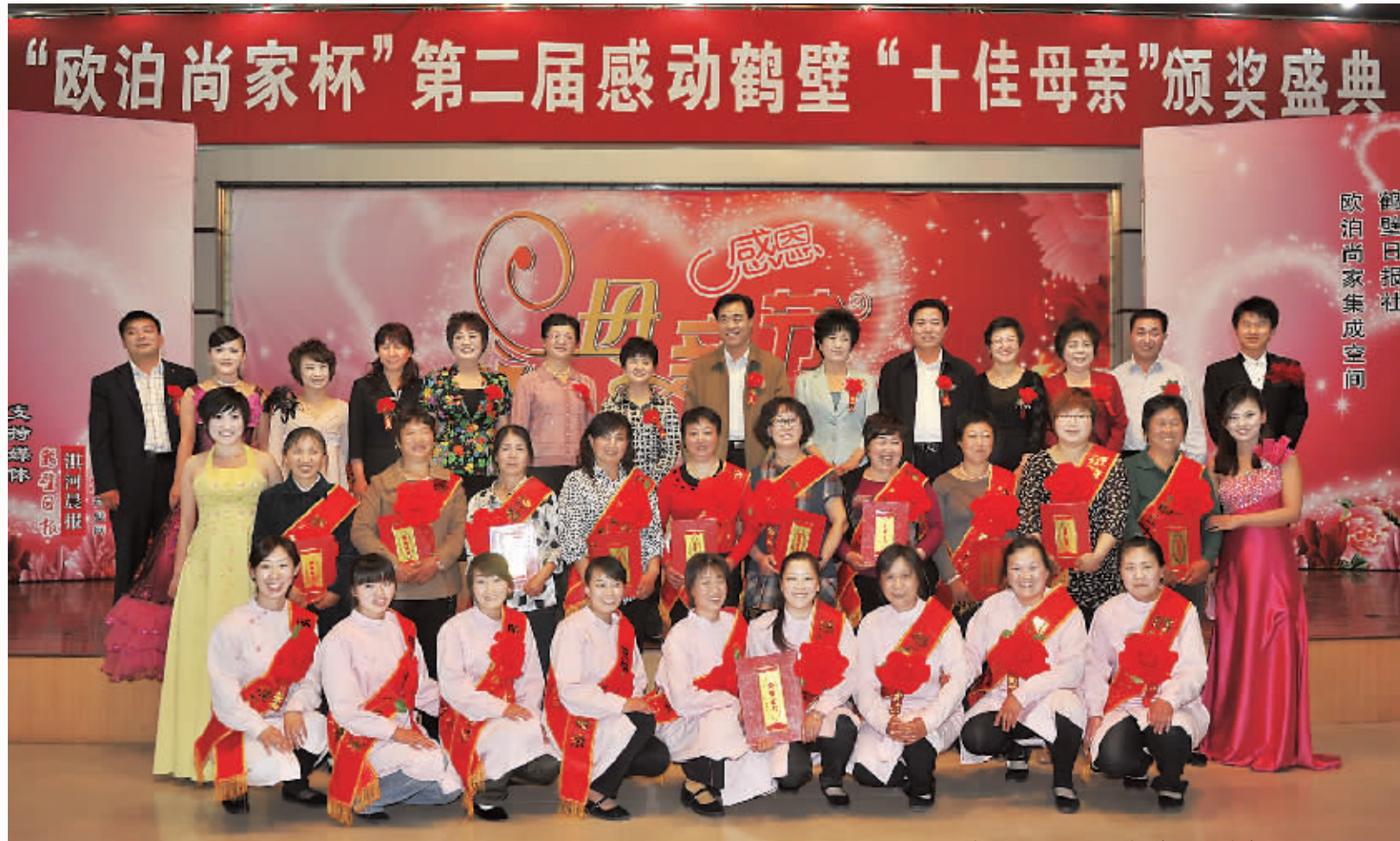
颁奖盛典结束后，市领导和获奖者、赞助企业负责人、演员合影留念。