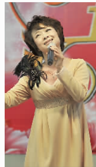
李莹女声独唱《烛光里的妈妈》。