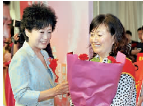
市人大常委会副主任郭南平为“十佳母亲”颁奖。