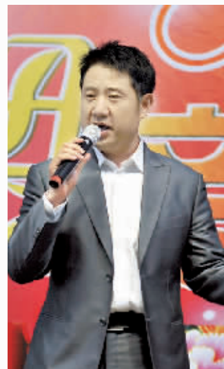
安东男声独唱《懂你》。