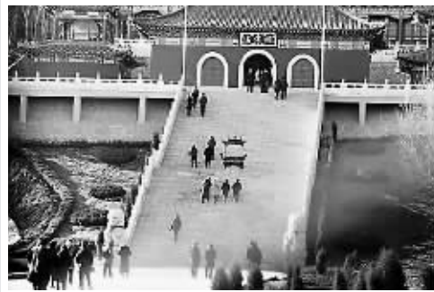
投资者在“考察”南山公司项目。