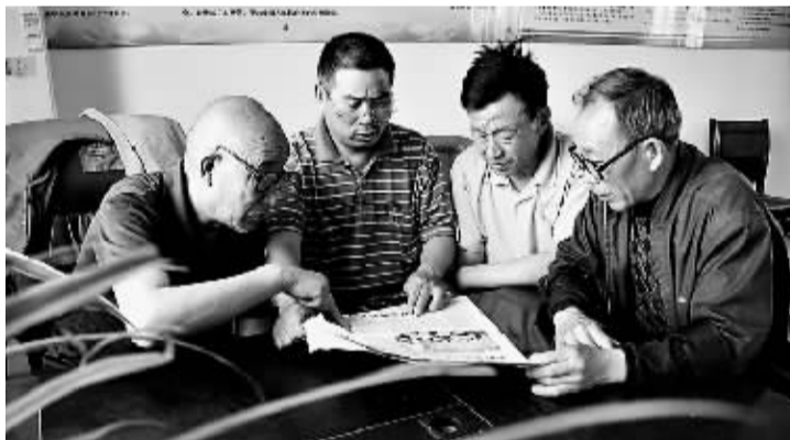
水峪新村村民在一起阅读《鹤壁日报》上关于总理给村民回信的报道。

总理走后,省地矿局水文二队春节期间为该村打了6眼机井,使村里1400亩农田得到灌溉。为将感谢之情和想念之情传达给总理,今年3月