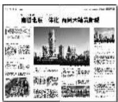
6月1日04、05版 (南进北联一体化,两网六轴筑新城)

投稿邮箱: dengyeran@126.com QQ: 408620189 短信: 15039233359