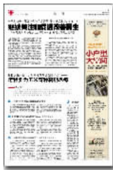
3月4日03版 《程相文托 全国人大代表姚菊泉 给总理捎信儿》