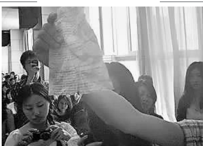
一考生拿着一份答案让大家拍照取证。

很多考生将纸条与试卷比对应后发现,纸条上的题目和答案与试卷的题目一一对应,顺序一致,且都是标准答案。