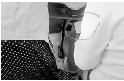
有人在抄袭。