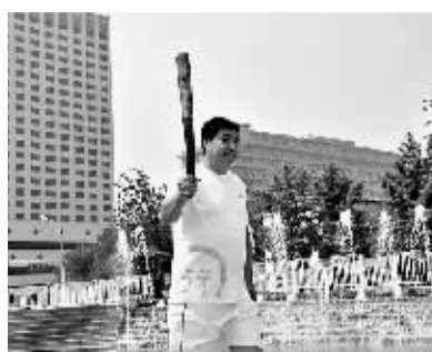
9日,北京奥运会火炬手王义夫手持健行火炬在北京中华世纪坛接力。

6月9日,由共青团青海省委发起的“健行无疆—2011大学自强毕业生公益激励就业”活动启动仪式在北京中华世纪坛举行,本次活动邀请北京奥运会火炬手参与,旨在发挥火炬手的影响力帮助大学毕业生转变就业观念、邀请火炬手为毕业生进行就业指导培训、动员社会力量为大学生就业拓宽渠道。(据新华社)