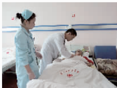
▲认真细致的诊疗服务。