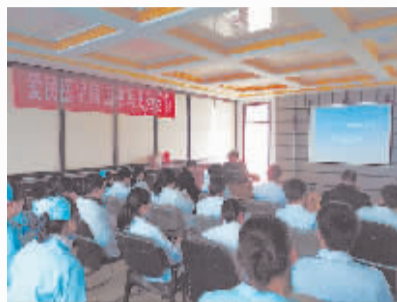
▲邀请新乡医学院专家来讲课。

免费健康体检套餐,并向出租车司机朋友赠送礼品,对普查出疾病的患者一律限价治疗;向全市居民免费发放价值1000元的“爱心医疗援助卡”,医院就是希望援助工程能惠及有需要的人,让他们从公益活动中切实得到好处,帮助他们解决实实在在的难题,每天都有人手持爱心医疗援助卡参加体检活动,无论是充满