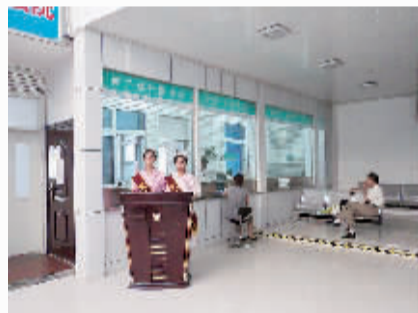
▲亲情化的导诊服务。