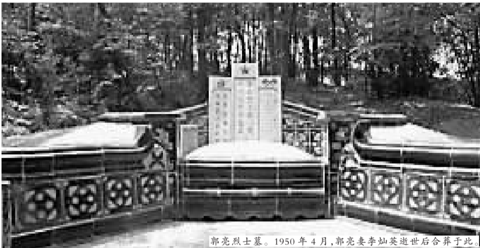
郭亮烈士墓。1950年4月,郭亮妻李灿英逝世后合葬于此。

遇害前,郭亮给妻子李灿英写了一封遗书,坦荡地称:“亮东奔西走,无家无国。我事毕矣!”