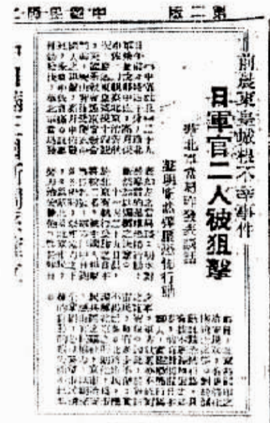
事发后《晨报》刊登的日军被刺消息。