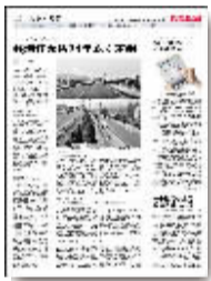
7月25日12版 《钱塘江大桥屹立74年不倒》

投稿方式 邮箱:dengyeran@126.com QQ群:155495021 短信:15039233359 大河鹤壁网评论论坛: http://bbs.hebiw.com/