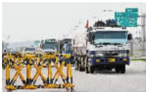
运送300吨面粉的卡车车队通过韩国边境检查站。

韩国一些民间机构26日援助朝鲜300吨面粉，为去年11月以来韩方向朝方提供的首批面粉援助。韩方期望，借此促进与朝方缓和关系。