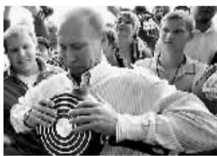
普京视察“谢利格勒-2011”青年论坛时尝试扳弯一口煎锅。