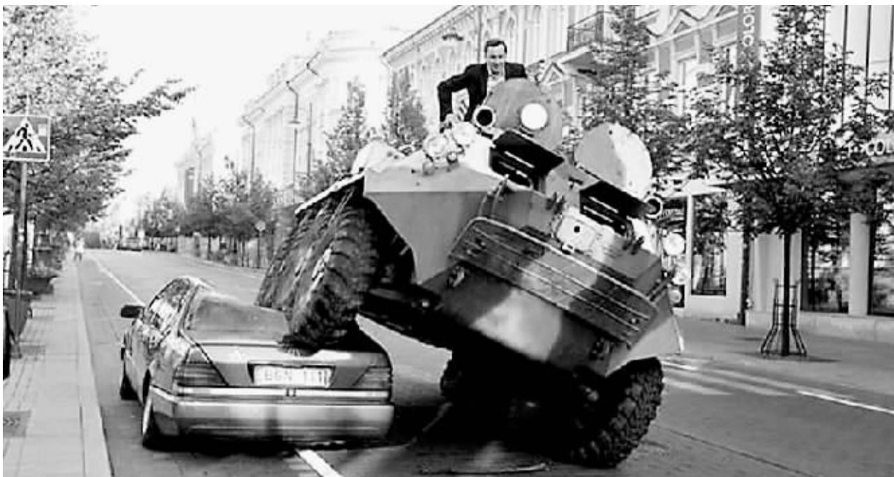
立陶宛首都维尔纽斯市