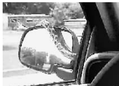
大蛇随后缠绕在后视镜上,已经准备好发动攻击。

想象一下,你正在公路上专心开车,突然一条大蛇出现在前面的风挡玻璃上,你会有怎样的反应?这件怪事就在上周被美国田纳西州的费希尔一家撞上了!