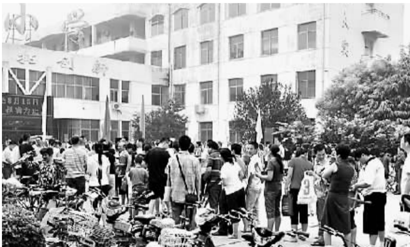
鹤翔小学门口,为孩子报名的家长排起长队。

近7时,记者来到淇滨小学门口,报名上幼儿园处有近10个家长在排队,但未见到一年级排队报名的队伍,原来该校派一名工作人员早晨6时就开始发号,排队等号的队伍已经散去,目前派发出了80多个序号。该工