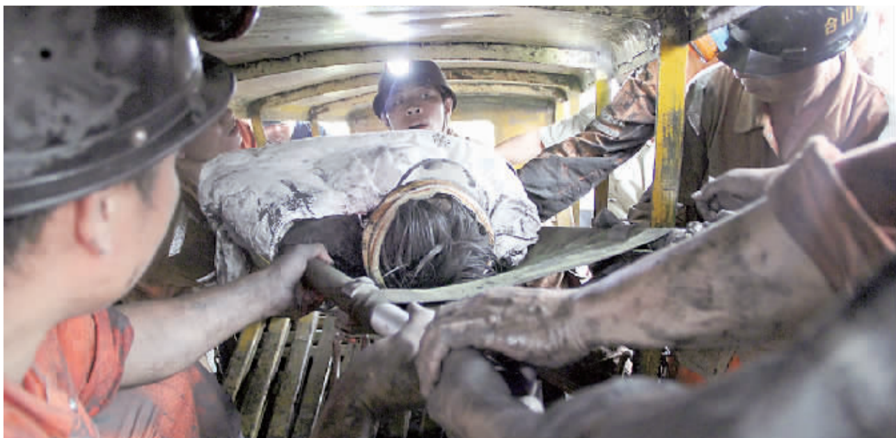
7月10日,合山煤矿塌陷事故第二名获救矿工顺利升井。