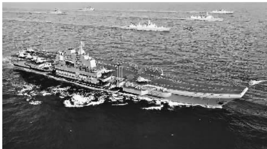
“瓦良格”号航母编队想象图。(资料图片)

报告认为,航母的服役不一定会加强对台湾的空中力量,但能够切实加强中国在其他海域的海上航空力量。