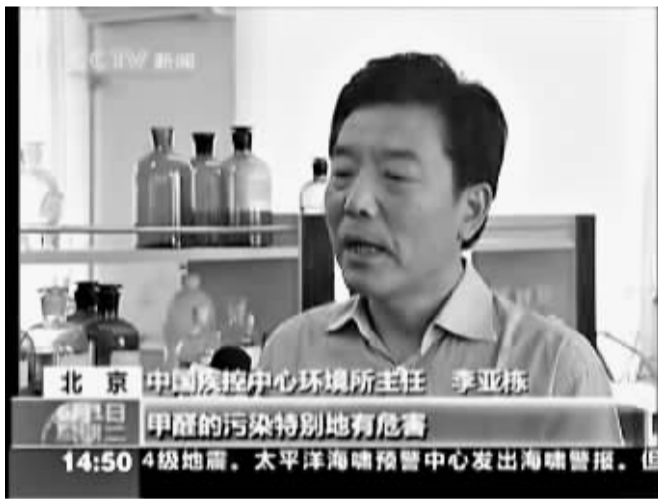
中央电视台新闻频道报道了海曼普快速除甲醛这一突破性科技成果。(电视画面截图)

很多人发现,一到夏天,在新装修房屋或装修年限不长的房屋内生活,胸闷、气短、呼吸道疾病等现象要高于春、秋两季,尤其是老人和儿童,长期处于这种环境下,身体健康每况愈下。