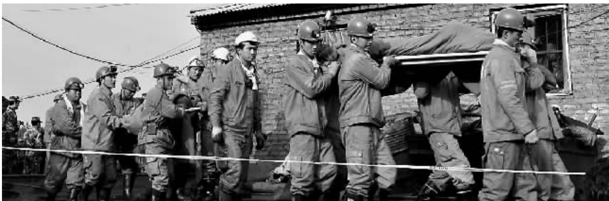
8月30日,获救矿工被抬出。