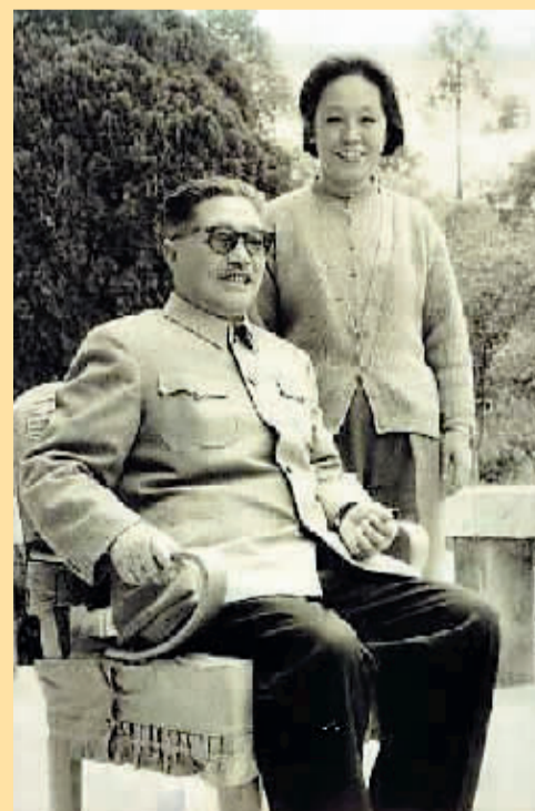
1966年4月，成都，贺龙与薛明的最后一张合影。

贺胡子几十年走南闯北，什么女人没见过，但薛明真正征服了他的心。一次在大会上作报告，贺龙竟然顺口说道：“我贺龙把一切都献给党了，包括生命、财产，只有那个青衣美人薛明是属于我的！”引起哄堂大笑。——摘自《脍炙英雄》