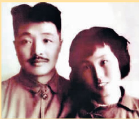
1942年8月1日，贺龙与薛明结婚时留影。

贺龙元帅夫人薛明因病于2011年8月31日下午在北京逝世，享年95岁。这是中国十大元帅夫人中最后一位去世的老人。