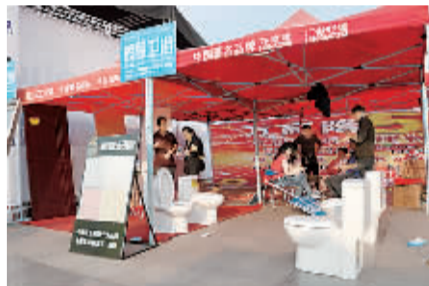
万商隆建材城展区。