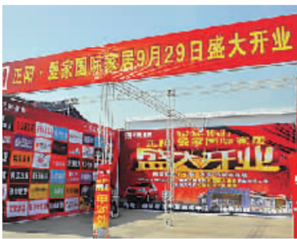
正阳·爱家国际家居展区。晨报记者 赵永强 摄

开业期间，凡进店顾客，均有机会参加“爱家寻宝”、购物赠送精美礼品、凭预售金卡领取大礼包、购物赠送汽车抽奖券等活动。9月29日至10月2日，来正阳·爱家国际家居购物的顾客，还有机会参加“中国黄金”钻戒（价值4999元）、品牌电脑、液晶电视和电动自行车的抽奖活动。“开业期间，凡在正阳·爱家国际家居购物的顾客，均可持消费凭证报销20元车费。”刘女士说。