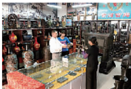
黄河古陶研制厂。

“黄河古陶研制厂是我省文化生产示范基地，产品荣获我省首届民间艺术节金奖，同时被指定为省旅游产品生产企业。黄河古陶销售网络已覆盖全国大部分工艺市场，并远销日本、法国、美国、德国、新西兰及东南亚，备受国内外客户青睐。”陈中超告诉记者，希望通过这次文化节让更多市民了解黄河古陶、爱上黄河古陶。