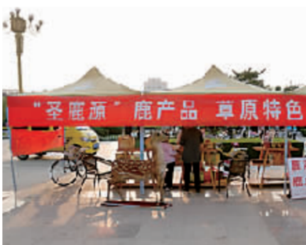
圣鹿源鹿产品展区。

“公司拥有我国最大的种鹿繁育和鹿产品精深加工基地，公司生产的鹿茸、鹿鞭、鹿肉、鹿酒、鹿茸茶、鹿茸茶、茸参胶囊、系列超微冻干粉、鹿皮革制品等十二大类200多个品种，深受广大消费者青睐。鹿茸超微冻干粉具有固肾益肾、强筋健骨、催乳、双向调节血压的作用；茸参胶囊可治疗气血不足、体质虚弱、神经衰弱等。这次我们展出的不仅有适合市民自用的产品，还有高档鹿产品礼盒系列。”付秀先说。