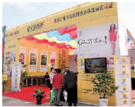
元洲装饰展区。

借秋季住宅产业文化节，鹤壁元洲装饰首次亮相，为开拓市场，即日起至10月31日，元洲装饰针对客户推出八大优惠措施：签单后获双倍订金返还，充当工程款；专属设计师一对一进行户型解析；交工程款2万元以上，可获精品室内门；组团享受家装1%的让利；今年12月31日前领结婚证的业主，可享受家装2%的让利；施工完工后，公司赠送开荒保洁金300元。