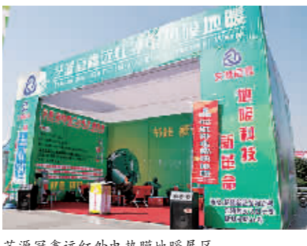
艺源冠鑫远红外线电热膜地暖展区。

据悉，艺源冠鑫远红外线电热膜经系统通电后，使室内均匀升温。“艺源冠鑫采用的智能化控制系统，采暖时段、房间、温度都可以自主调节，最大限度地节约了用电。在房屋采用节能设计条件下，取暖费用比水暖节省2/3，比用空调节省1/2还多。”王见雨告诉记者，艺源冠鑫地暖系统使用的是在国际上被称为“阳光生命线”的波长为9.5微米的波段，该波段对人体有理疗保健作用，可促进人体新陈代谢，改善微循环系统，使用起来更安全、健康。