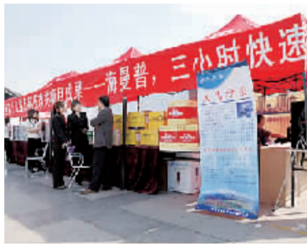
鹤壁市春天保健品有限公司展区。

除了海曼普空气净化器外，鹤壁市春天保健品有限公司文化节期间还展出了中宏蜂胶软胶囊、中宏骨胶原蛋白片、金多美亮乳糖等多种产品。