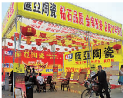
汇亚陶瓷展区。

“凭借‘以质量求生存，以信誉谋发展’的经营理念，汇亚陶瓷深受广大消费者喜爱。我们以诚信为品牌价值理念，走精品路线，在保证质量的同时，力争把更多实惠让利给顾客。”呼志伟说。