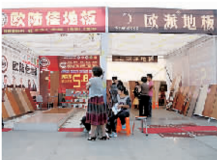
欧陆佳地板、欧派地板展区。

“欧陆佳地板具有耐磨损、抗冲击力强等特点，同时采用德国先进基层技术，超强热学吸散结构，避免潮气渗入，能最大限度地延长地板的使用寿命。10月9日前，天泰建材店将推出特价限量地板以满足顾客需求。”欧陆佳地板鹤壁店经理徐朝辉告诉记者，10月9日前，欧陆佳全场地板5.8折。同时，凡进店顾客均有礼品相赠。