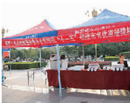
奔泰净水机展区。

付文峰说，上海开能集团作为全球最大的全屋净(软)水制造基地，不久前获得审批，成为我国第一家家用净水器上市企业，其旗下奔泰净水设备是世博、奥运会饮水设备供应商。