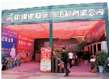
中翔建材装饰工程有限公司展区。

在秋季住宅文化节期间，交订金的客户在经销商、建材市场给予的活动最低价基础上，10月31日前还可享受厂家返现金的优惠。