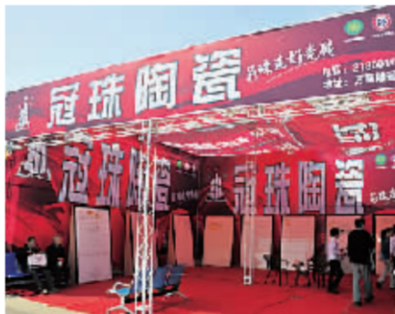
冠珠陶瓷展区。

“参加此次住宅文化节，是我们回馈消费者的开始，店内优惠活动将持续到10月17日。”徐文娟表示。