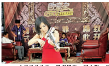
宜佳家居展区。

宜佳家居广场被评为“十一五”鹤壁市优秀家居卖场，为回馈消费者，宜佳家居联合超凡设计部和几大家具、建材商，联合推出了整体打包路线，并推出厂家让利特价款等优惠活动。