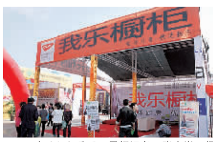
我乐橱柜展区。

最后，陈先生表示，感谢秋季住宅产业文化节给商户们提供了一个平台，让更多市民了解了我乐橱柜及其它商品。