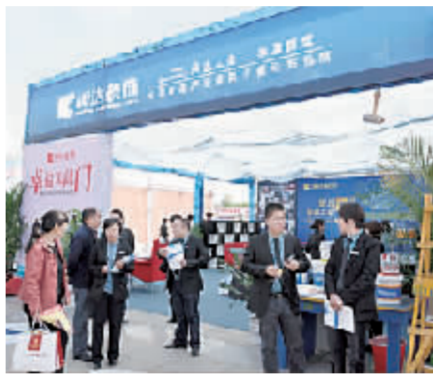
阔达装饰展区。

文化节日期间，该公司推出了订订金或签单即可抽奖活动，免费为新婚夫妇进行量房、户型分析、整体家居预算、环保检测等服务。