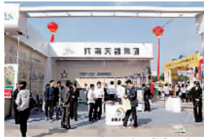
河南天馨集团展区。

天馨·中央公园三期主要为面积80-120平方米的精品户型。“市民可以前来看房,并且我们开盘当天会推出优惠活动,希望有意购房的市民能够抓住这个机遇。”