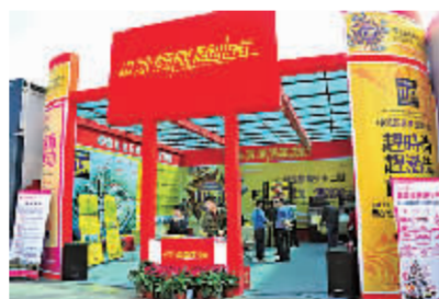
中凯国际商业街展区。

据介绍,中凯国际悦城坐落在我市未来的城市中心和商业中心处,升值潜力大。其主体部分作为住宅、写字楼、公寓使用,目前项目主推中凯商业街二期、中凯数码大厦和公寓。中凯商业街是纯独立产权的商铺,将被打造成我市时尚潮流购物街区。肯德基、如家快捷、永乐电器、咏歌汇KTV、神采飞扬电玩等企业即将入驻。