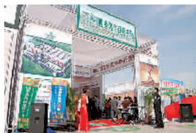
四季青集团的展位。

“四季青国际家居广场总面积5万平方米,三层主体结构,中央观景大厅,四季如春的中央空调,观光电梯、代步电梯、升降电梯为鹤壁最高端的家居、家装、家饰商场量身定做,让购物成为一种享受,让经营成为一种身份。”索秋法告诉记者,为了让商铺租赁者在出租商铺后没有后顾之忧,他们聘请了专业的经营团队来运营,在管理上实行统一规划、统一经营、统一推广的集中管理模式,保证四季青家居广场天天旺财。