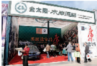
金太阳·水岸原树展区。

记者了解到,文化节上金太阳·水岸原树销售的10栋别墅紧邻淇河岸边,同时靠近107国道,区位优势明显,享有“一河五园天然景,日观鲫鱼夜赏花”的美誉。