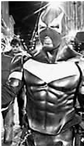
美国小伙街头扮“凤凰侠”。

美国西雅图市一名23岁的小伙穿着“蝙蝠侠”装,自称为“凤凰侠琼斯”,自告奋勇地上街维持治安。日前,“凤凰侠”因在“除暴安良”的过程中用胡椒粉“袭击”多人而被逮捕。