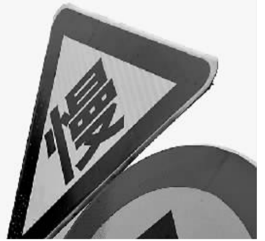
长沙主城区新建的商品房小区(9月8日摄)。