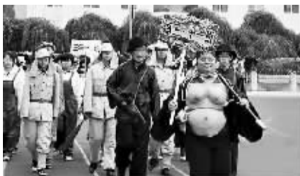
高中生穿侵华日军军服和汉奸服参加运动会。

一名自称是沈阳市第一中学高二年级学生的网友“碧波怒龙”在帖中称,这是学校运动会的一个传统环节“班级走队列”,每个班级都会穿各种各样的衣服和道具,“也是一种展现我们班级的形式”。他澄清说,遭网友谴责的一