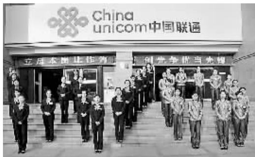
站成“WO”形的淇滨营业厅全体人员。

今年以来,鹤壁联通积极参加我市开展的“改进作风,改进服务,创群众满意窗口,创优质服务品牌”为主题的“双改双创”实践活动,按照活动总体要求,各县分公司、营业部的营业窗口,先后开展了亮标准、亮身份、亮承诺“三亮”活动和比技能、比作风、比业绩“三比”活动。活动中,各窗口认真听取客户意见,切实提升服务技能,理顺服务流程,完善服务体系,强化服务时限,积极主动做好为民服务的每一件事。特别是淇滨营业厅,活动