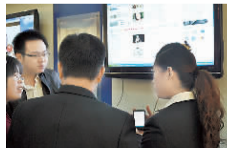
参会嘉宾们在体验“无线城市”。

针对此次鹤壁移动公司举办的“动力5000万,有您更精彩”中小企业信息化助飞工程暨鹤壁“无线城市”推介会,参会嘉宾们不约而同地表示称赞,认为这是他们了解移动今后发展的绝佳机会,也是相互交流、沟通增进合作的最好平台。