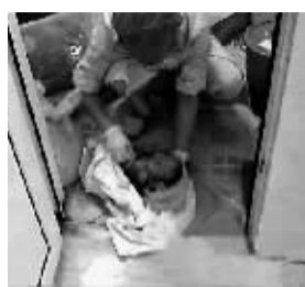
婴儿被护士抱去救治。