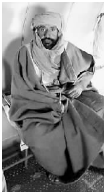
赛义夫被捕后在一架飞机里。