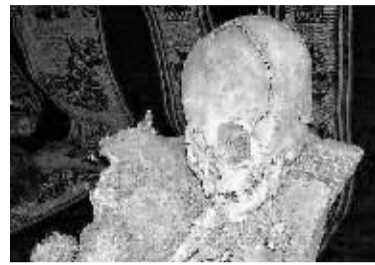
干尸的头骨和下面身体部分长度相当。

宇宙中到底存不存在外星人？若存在的话他们是否登陆过地球？多年来科学家们对相关课题的研究从未停止过，近日有关人员在南美洲秘鲁发现两具疑似外星人的干尸，这或许能推动该课题研究向前迈出重要一步。