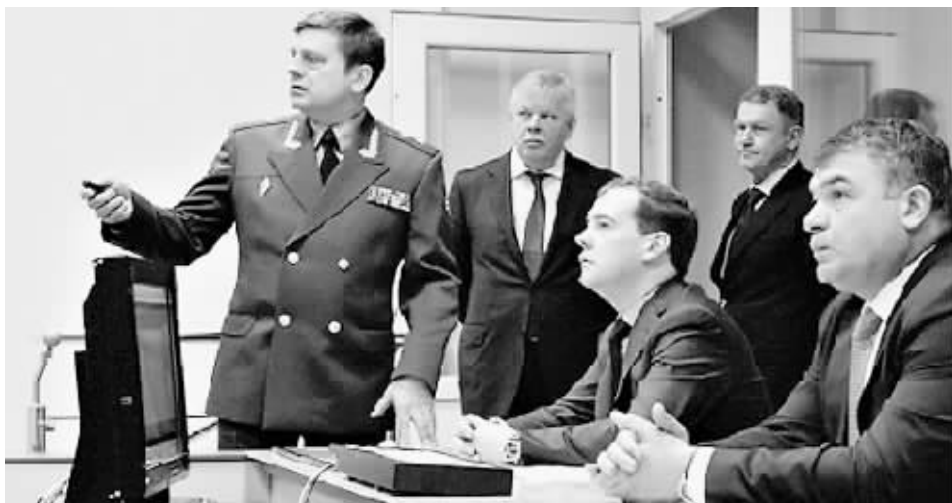
11月29日,在俄罗斯加里宁格勒州,俄总统梅德韦杰夫(右三)参观导弹预警雷达系统。

据法国媒体报道,俄罗斯总统梅德韦杰夫 11 月 29 日启动了位于欧洲“飞地”加里宁格勒的反导雷达系统,以应对包括美国在内的西方国家计划在欧洲部署的导弹防御系统。