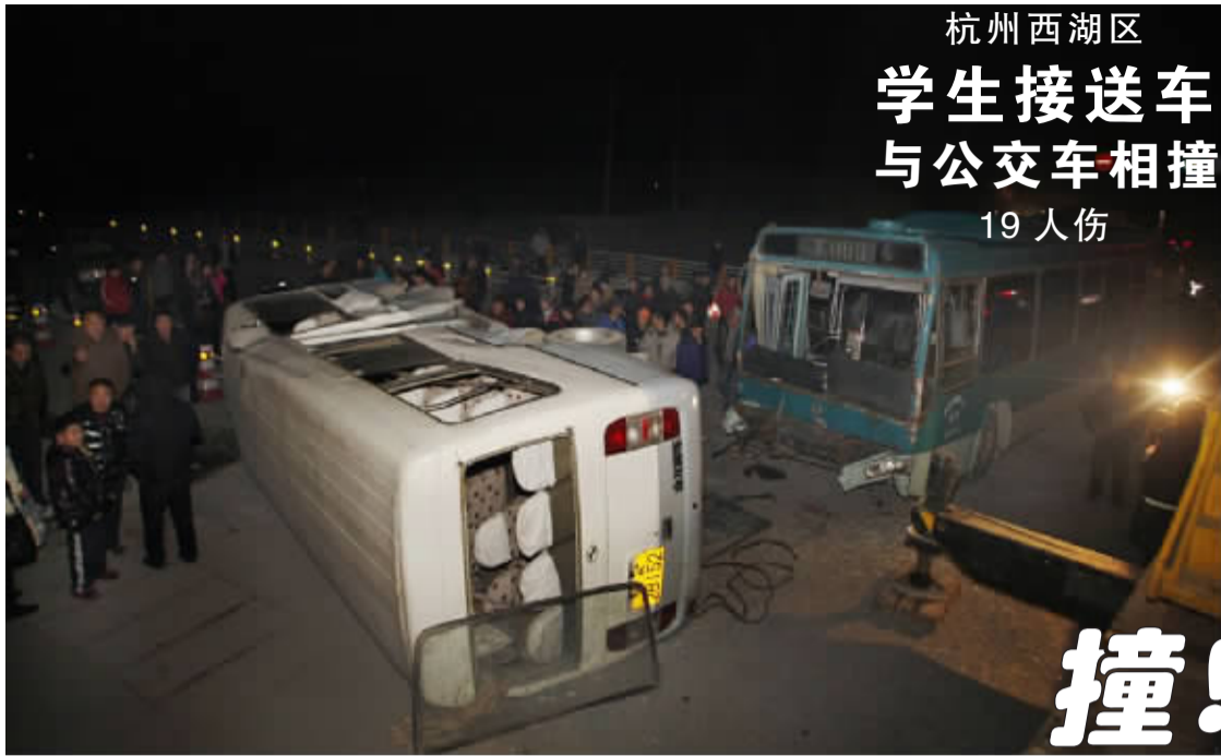
杭州西湖区 学生接送车 与公交车相撞 19人伤