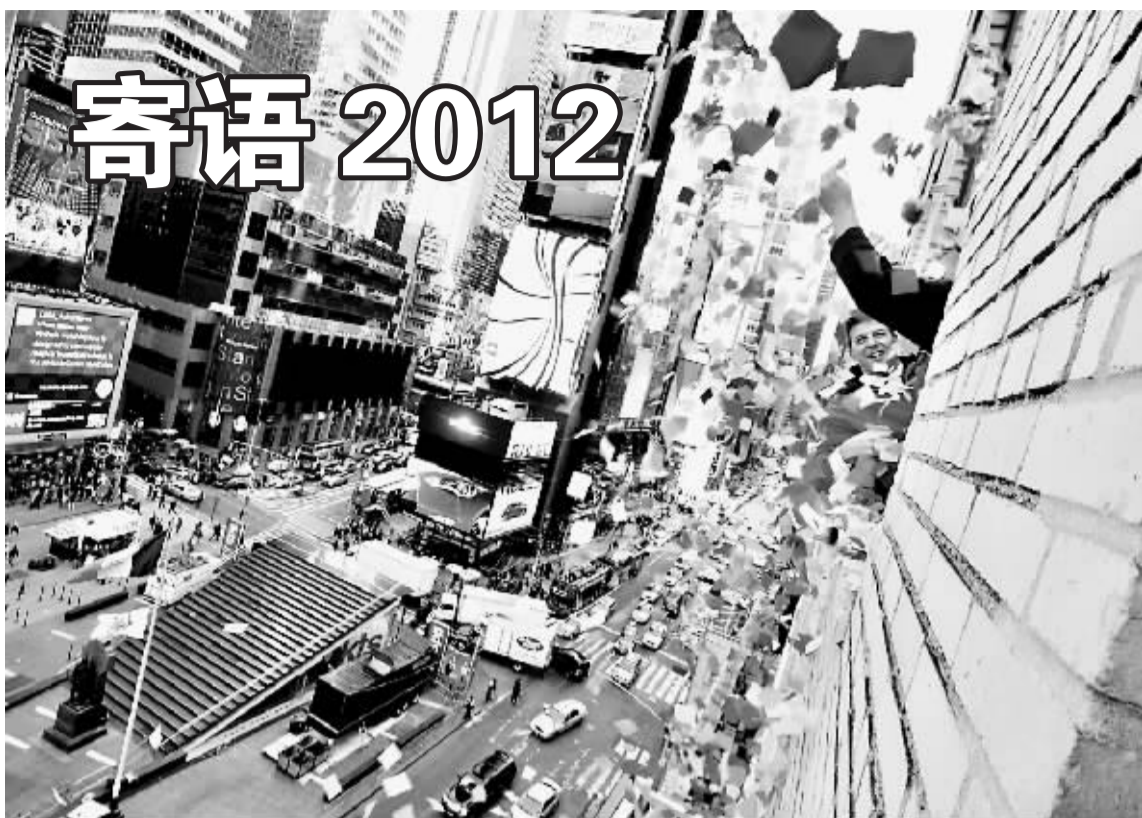
12月29日,在美国纽约时报广场,工作人员在演练抛洒五彩心愿纸片。

2012年来临之际,纽约时报广场咨询中心内专门设立了一面心愿墙,来自世界各地的游客都可以将写有自己新年美好心愿的五彩纸片贴到上边。所有的纸片将被收集起来,在2012年新年钟声敲响之际,从时报广场上空飘散而下。