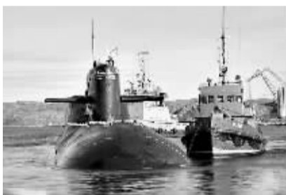
“叶卡捷琳堡”号的核潜艇。

目前还不清楚火灾发生的具体原因。俄罗斯军事检察官发言人表示,军方已展开对火灾原因的调查,当局将追究涉嫌因疏忽导致军事财产毁坏者的责任。