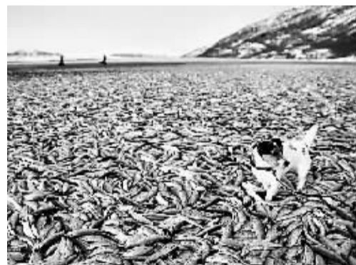
挪威海滩上惊现20吨搁浅死亡的鱼。

据英国《每日邮报》2日报道,近日,挪威民众在该国北部一处海滩上发现成吨的死鱼,共计20吨,引发关于“世界末日”猜测的担忧。但专家对此持不同意见称,这些死鱼成吨出现在海滩上,是由于被其他大鱼追赶或受天气因素影响。