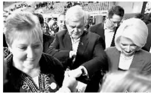
1月3日,共和党总统候选人金里奇拉票后离开。

1月3日晚,美国4年一度的总统大选“前哨战”——共和党党内初选在美国中部小州艾奥瓦正式投票。对于谋求连任的奥巴马而言,艾奥瓦之夜的意义重大,他必须弄清楚谁可能来抢他手中的白宫钥匙。