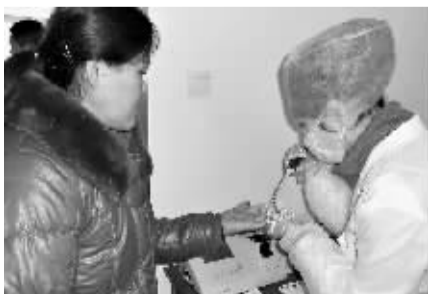
工作人员在采集血样。

者有个判断。初判合格的进入初筛检验室,进行血型、乙肝表面抗原、转氨酶、血红蛋白快速检测,全部合格才可以采血。采过后送入成分制备室过滤白细胞,病毒灭活,接下来再检验