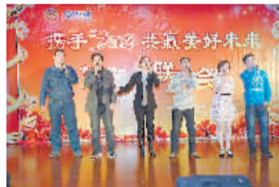
情景剧歌舞《年代秀》。