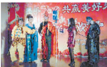
情景喜剧《大话西游》。