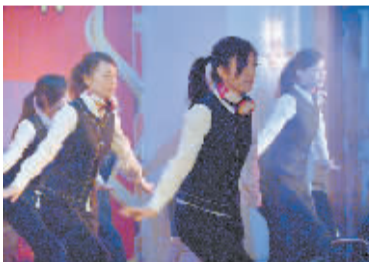
舞蹈《格子间的风采》。