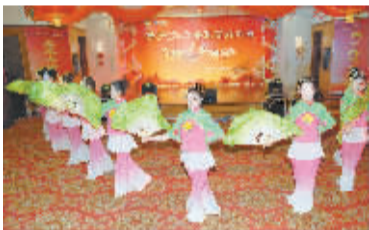
舞蹈《茉莉花》。