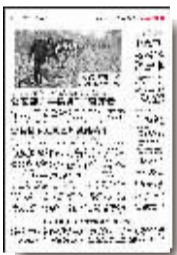
1月17日14版《实名制下无票也能进站乘车》

投稿邮箱:dengyeran@126.com QQ群:155495021 短信:15039233359 大河鹤壁网评论论坛: http://bbs.hebiw.com/