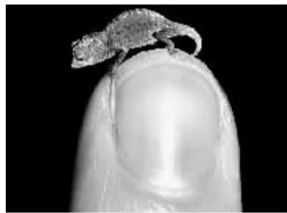
全球最小的变色龙。

据外媒14日报道，科学家近日在马达加斯加岛上发现了全球最小的变色龙，也是世界上最小的爬行动物之一。