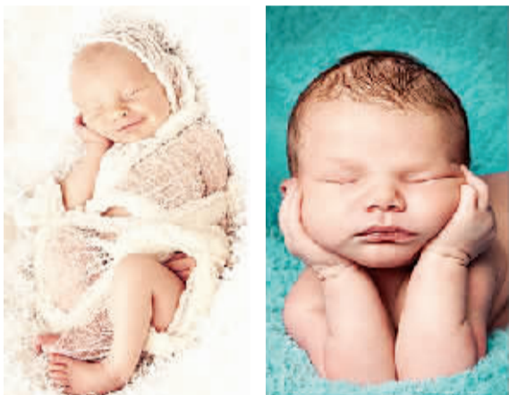
这些甜睡的婴儿嘴角洋溢着微笑。