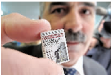
这期标题为“拥抱世界”的报纸有32页，须借助放大镜才能阅读。