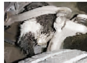
猫藏进了减震器弹簧处。

17日上午11时许，在渝遂高速G93主线收费站，高速执法十大队的执法人员正在对驶入高速公路的车辆进行检查，当检查到一辆白色奥迪轿车时，执法人员隐约听到车辆尾部有猫叫的声音。