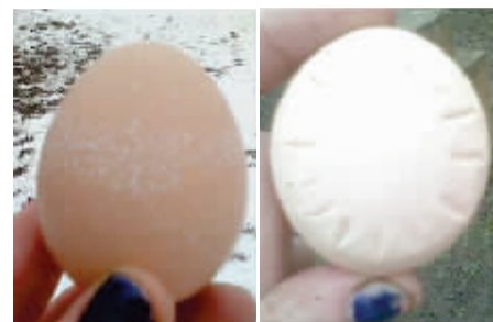
下雪前，罗茜的蛋壳上布满雪花般的白点（左）；晴天时，罗茜的蛋壳上出现太阳般的花纹。

2011年，安德森在当地一家农场商店里买下了罗茜。鸡类专家、作家夏洛特·波佩斯库说：“我从未听说鸡能预报天气。一般来说，鸡蛋的蛋壳与鸡的品种有关。不过，如果章鱼都能预测足球赛结果，鸡为什么不能预测天气呢？”（据人民网）